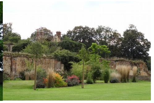
Une gravure du château au XIX e siècle L'orangerie